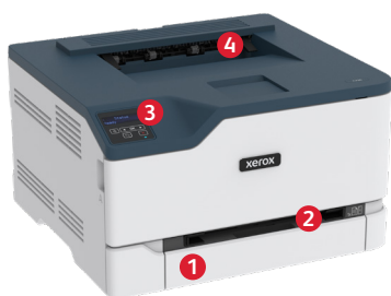
mpresora color Xerox® C230